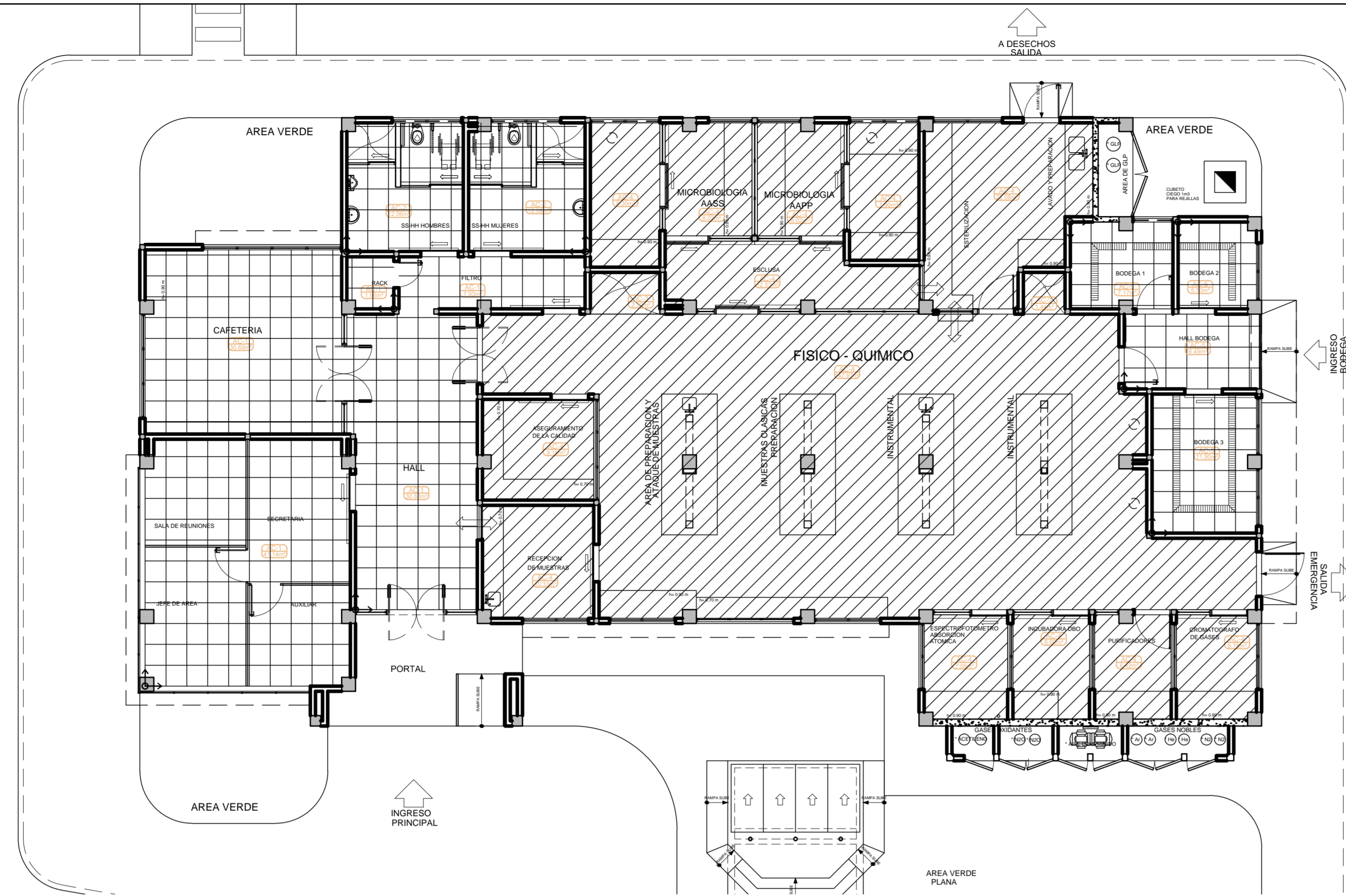
PLANTA DE TUMBADOS